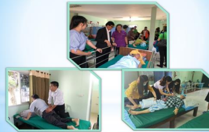
กิจกรรมกายภาพบำบัด ทุกวันจันทร์และพุธ